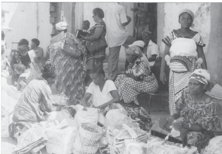
Носильщики Киву выступают против коррупции чиновников на границе и за свои экономические права