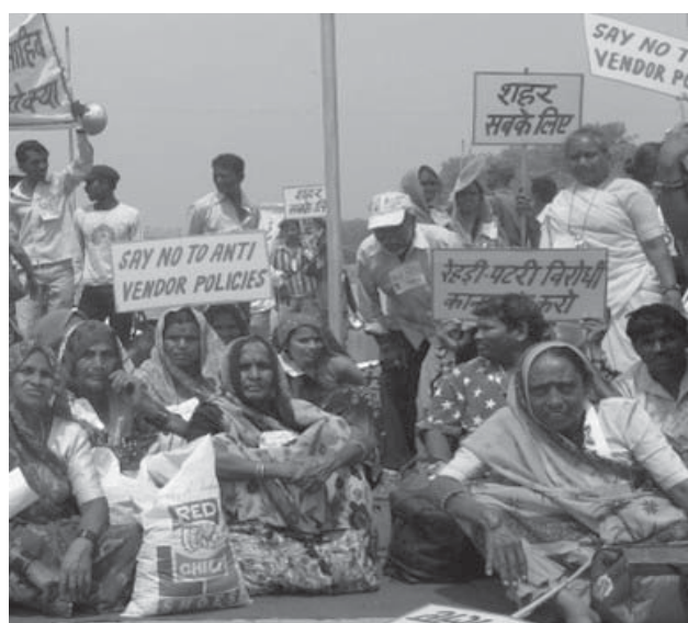
Уличные торговцы Дели требуют положить конец направленной против них политике

«Во время Чемпионата мира по футболу в ЮАР уличные торговцы понесли существенные потери, так как были вытеснены и выселены с мест торговли. Тот же самый подход применяется и в Дели. Давайте будем надеяться на то, что к Чемпионату мира по футболу в Бразилии городская беднота не будет жить, страшаясь потерять средства к существованию, а, наконец-то, будет иметь хоть какой-то повод для радости!», подытожила Пат Хорн, Международный координатор StreetNet International.