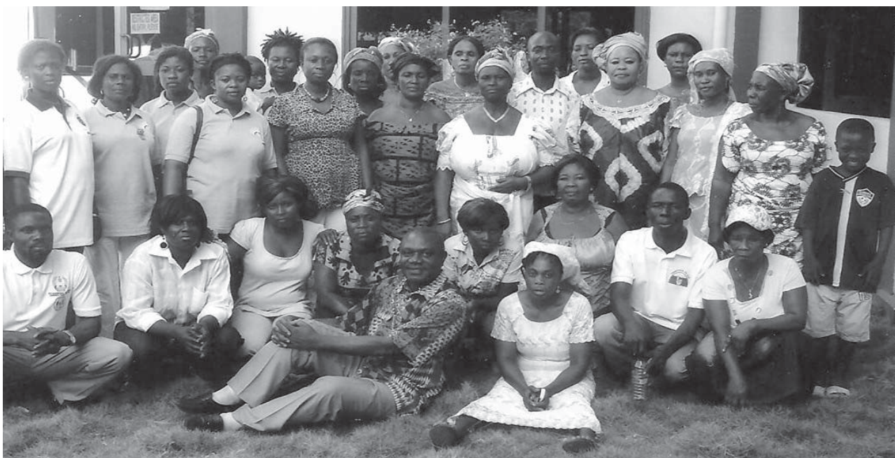
Члены Альянса StreetNet Ганы на семинаре по лидерству, 23-24 сентября 2010 года