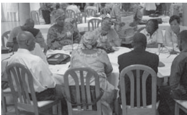
Делегаты Конгресса StreetNet принимают участие в работе его Комитетов

Что Вы еще хотели бы сказать читателям вестника StreetNet? Я надеюсь, что все мы сможем активно участвовать в работе StreetNet, так как нам необходимо стать сильнее, чтобы добиться социального и правового признания, положить конец бедности, маргинализации и отсутствию социальной защиты..