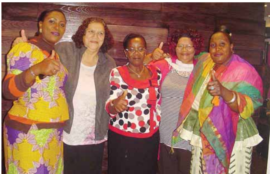
Представители Международной федерации домработников одобряют семинар WIEGO. Они дали важные советы на основании своего собственного опыта