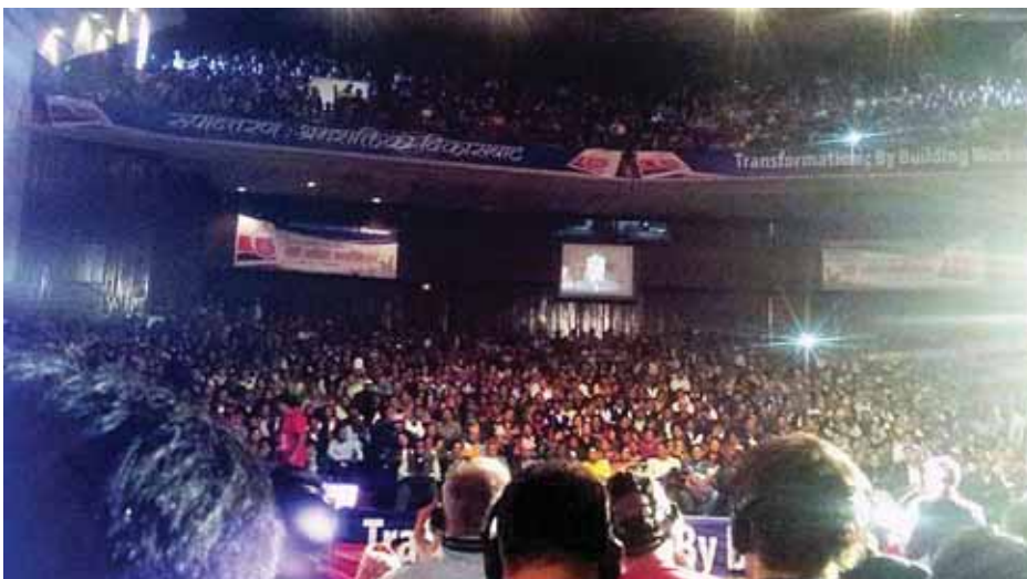
В процессе Съезда GEFONT

Это трудные времена, но с усилием всех двигаться в том же направлении, мы можем двигаться вперёд. Мы не должны теряться в дискуссиях, которые не приносят пользы всем членам.