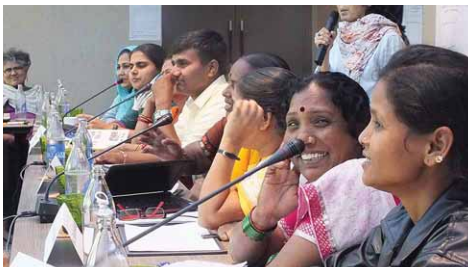
Участники семинара в Бангкоке