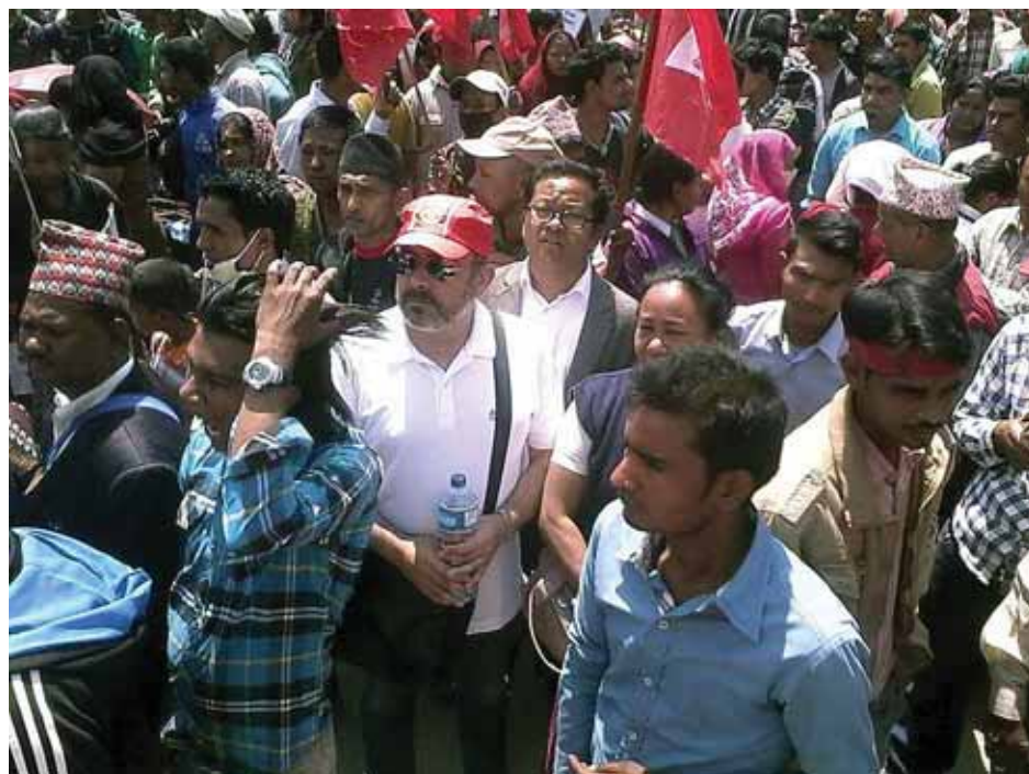
Уличные торговцы во время демонстрации