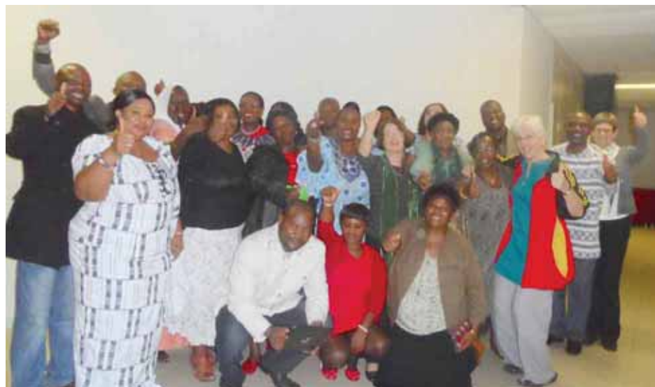
Выше на фото участники Африканского Регионального семинара - консультации. Семинар был нацелен на сбор мнений от представителей домработников, надомных работников, уличных торговцы и сборщиков мусора по вопросам, касающимся формализации неформальной экономики. Участники приехали в Йоханнесбург из Зимбабве, Кении, Танзании, Ганы, Сенегала и различных частей ЮАР, Того и Гвинеи

На данном семинаре неформальные трудящиеся участвовали в составлении политической платформы, в которой будут содержаться их требования для широкого обсуждения среди неформальных трудящихся и профактивистов, и которая будет использована на МКТ в мае-июне 2014 года. Другие цели этого семинара —