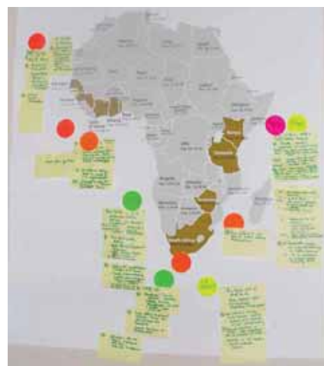
Выше: Одно из заданий, над которым должны были работать участники. Это фрагменты из моментов во время обсуждения в группе.