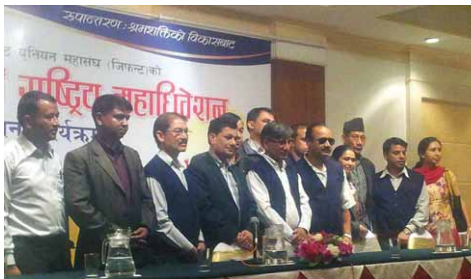
Исполнительный Комитет GEFONT

Центральный комитет NEST, состоящий из руководителей основных районов города, попросил, чтобы мы отправили письма в адрес правительства Непала,