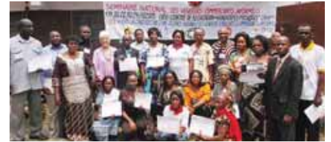
Все участники, которые принимали участие

Было сформировано четыре рабочие группы, чтобы обсудить следующие темы: лидерство и управление