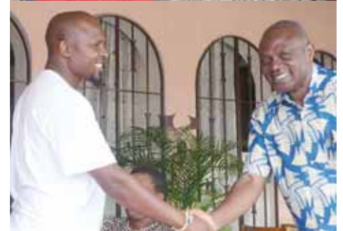
Семинар, который состоялся в Рюстенбурге, Южная Африка