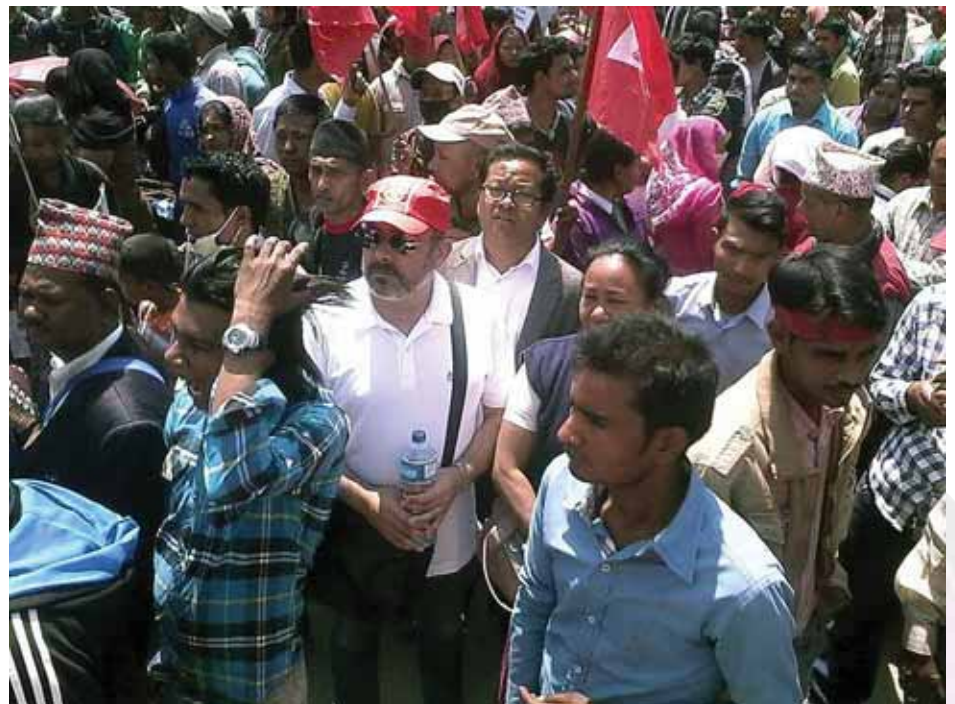
Vendedores ambulantes durante una manifestación