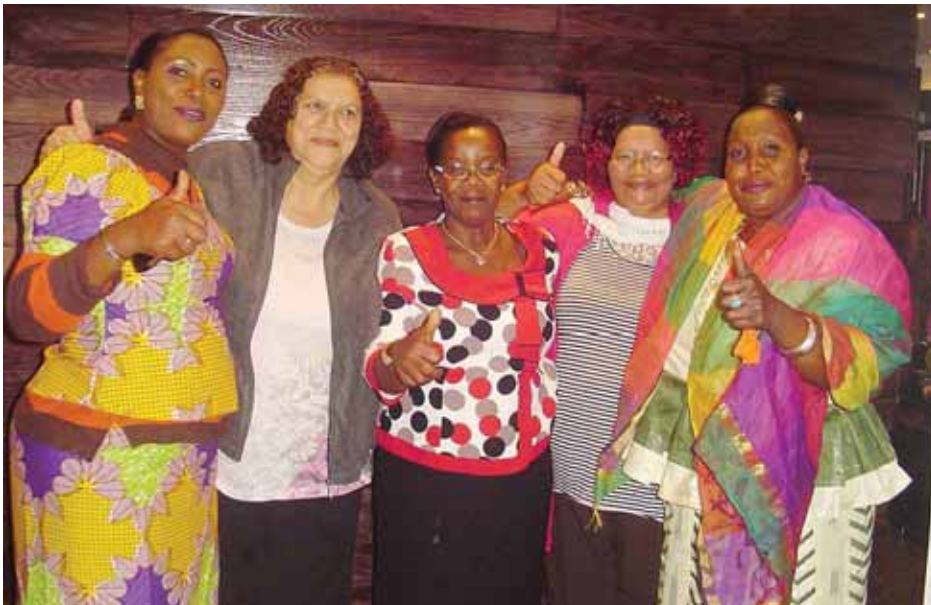
Representantes de la Federación de Trabajadoras Domésticas dan el visto bueno al Taller de WIEGO. Ellas dieron valiosos consejos basados en sus propias experiencias