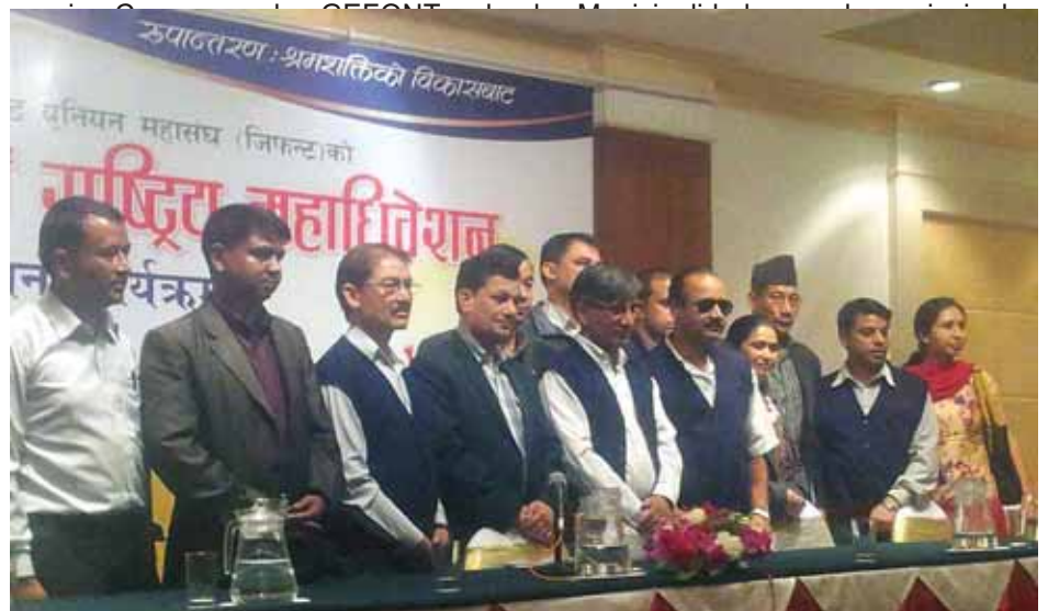
Comité Ejecutivo de GEFONT

El comité central de NEST, compuesto por los líderes de los principales distritos de la ciudad, nos piden que remitamos cartas, tanto al gobierno de Nepal como a