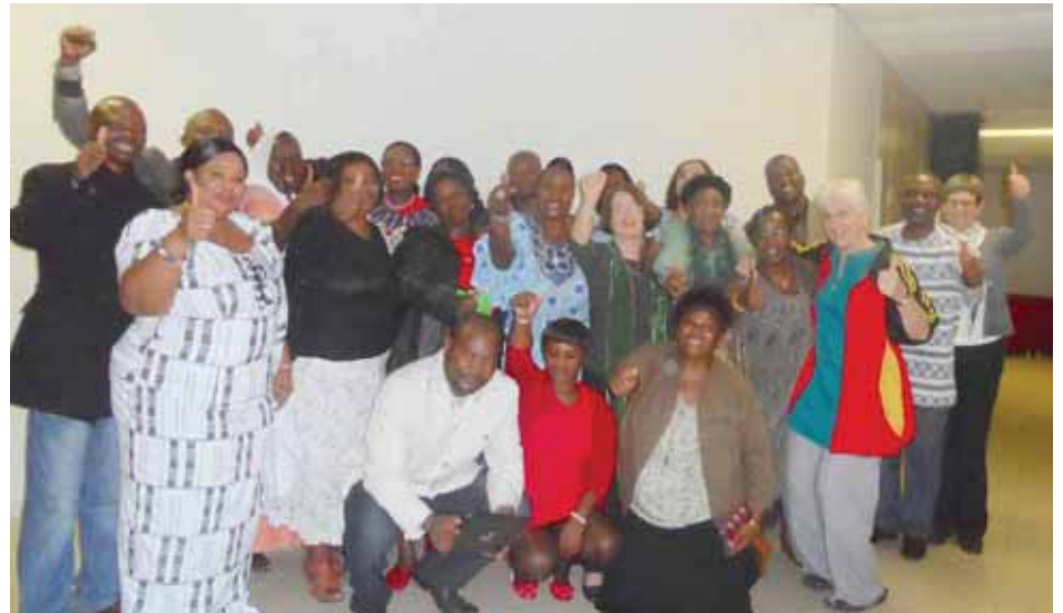
En la foto los participantes del Taller de Consulta Regional en el África. El taller tuvo como objetivo la recopilación de información de los representantes de los trabajadores domésticos, trabajadores basados en el hogar, vendedores ambulantes y recolectores de residuos en asuntos relativos a la formalización de la economía informal. Los participantes viajaron a Johannesburgo desde Zimbabue, Kenia, Tanzania, Ghana, Senegal, y diferentes partes de Sudáfrica, Togo y Guinea

Los trabajadores informales participaron en el taller con la elaboración del borrador de una plataforma indicando sus demandas para ser discutidas entre los trabajadores informales y los sindicalistas, las mismas que serán utilizadas en la CIT 2014 en mayo-junio. Uno de los objetivos del taller fue identificar maneras en las que los trabajadores informales puedan participar y