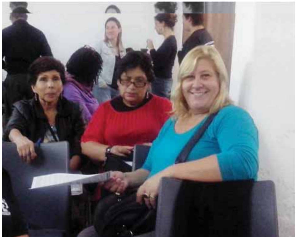
En la foto, las participantes que asistieron al taller de WIEGO en Argentina, de izquierda a

En el taller se reunieron varios representantes de la mal llamada economía informal, pero nosotros en StreetNet Internacional, somos un grupo que presenta retos más grandes por ser los que estamos en las calles trabajando continuamente. Nuestra postura como sector específico también tiene que ser planteada, corremos el peligro de la uniformidad si la discusión se enfoca en la "economía informal" como un todo. Espero que los representantes en la Conferencia de la OIT puedan hacer este trabajo. Suerte!.