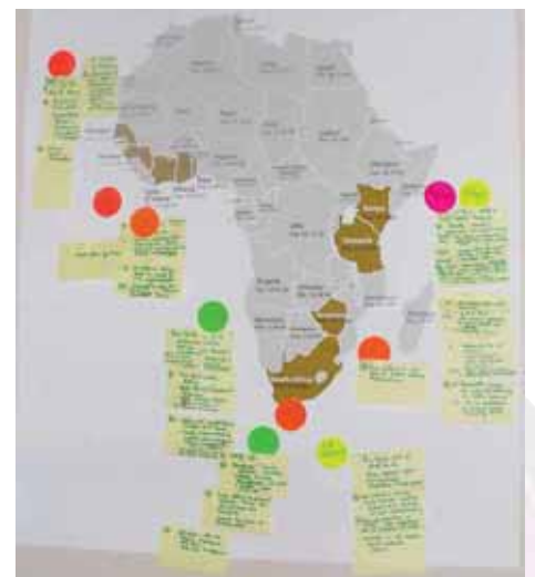
Una de las tareas en la que los participantes tuvieron que trabajar. Estos son fragmentos de los puntos destacados durante sus discusiones de grupo