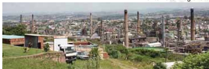
Visita SDCEA: Observando el impacto ambiental de las Compañías de petróleo