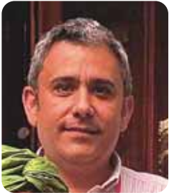
Por César García Arnal Secretario StreetNet Internacional