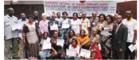
Todos los participantes que asistieron

Se formaron cuatro grupos de trabajo para discutir los siguientes temas: liderazgo y gestión del proceso de la Alianza, el sector de actividad cubierto, asuntos de afiliados y del personal, el equilibrio regional y representación en las