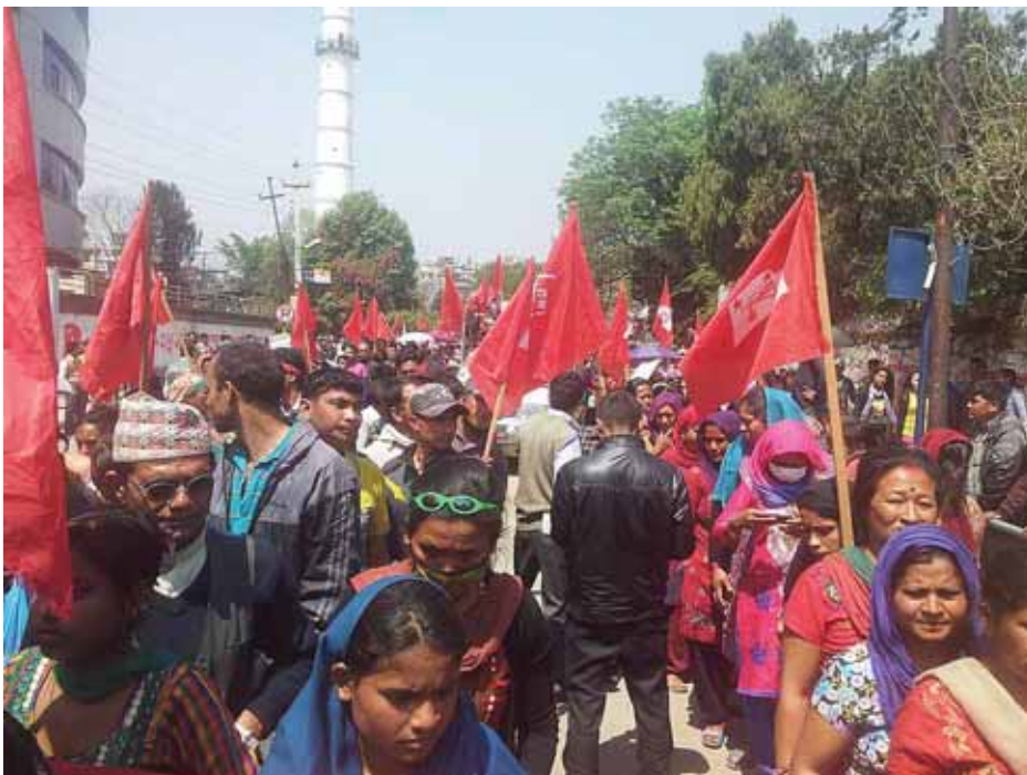
Vendedores ambulantes durante una manifestación