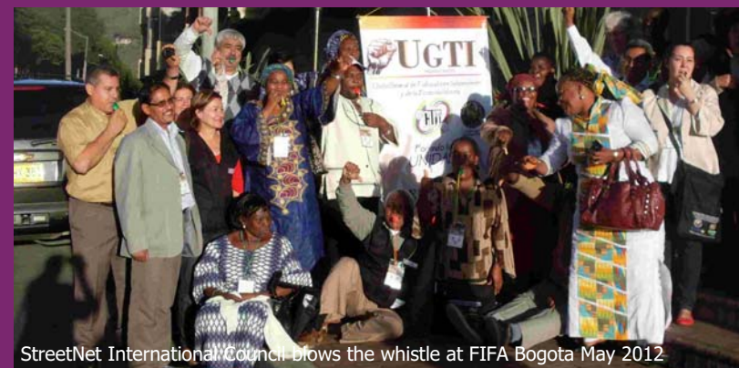
StreetNet International Council blows the whistle at FIFA Bogota May 2012

Les vendeurs de rue, jeunes et vieux, hommes et femmes – mettons-nous ensemble aujourd'hui pour revendiquer nos droits en tant que travailleurs!