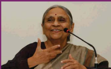
Ela Bhatt. FONDATRICE DE L'ASSOCIATION DES FEMMES TRAVAILLEUSES

Le lancement de StreetNet a eu lieu du 12 au 14 Novembre 2002 à Durban. La réunion a adopté une Constitution, élu un Comité intérimaire de 7 personnes et adopté trois résolutions concernant la politique sur les partis politiques, la classe et le genre ainsi que la politique sur la viabilité et l'autonomie financière.