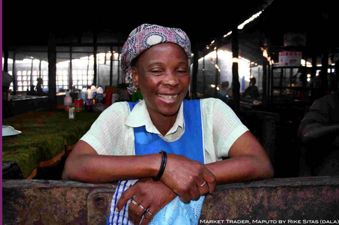
MARKET TRADER, MAPUTO BY RIKE SITAS (DALA)

"Je suis vraiment fier que StreetNet célèbre la première Journée internationale des vendeurs de rue et son 10 e anniversaire pendant que je suis Président. StreetNet a considérablement augmenté l'effectif de ses adhérents pendant ces dix années pour devenir une organisation véritablement mondiale. StreetNet est reconnu comme la voix des vendeurs de rue et respecté pour ses politiques, programmes et campagnes. Que vive StreetNet!"