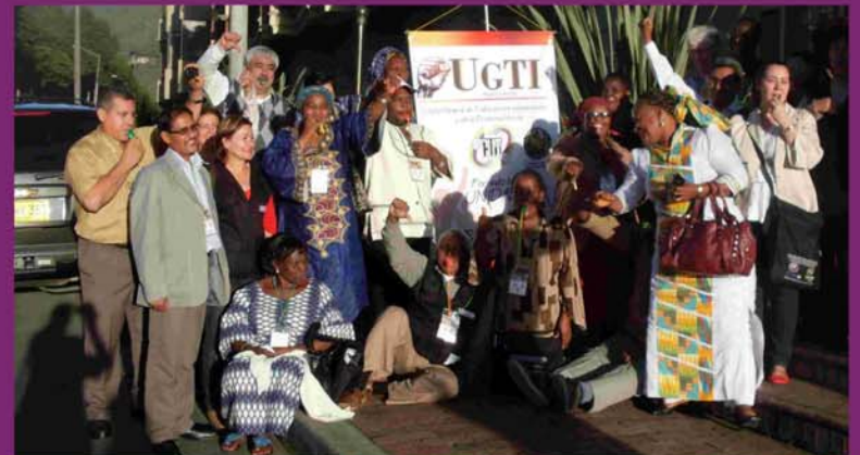
Международный совет StreetNet грозит FIFA предупреждением, Богота, май 2012

Уличные торговцы — молодые и старые, женщины и мужчины — давайте сегодня объединимся и потребуем соблюдения наших прав как трудящихся!